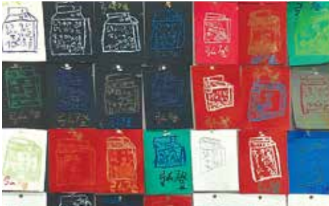
「毎日一本牛乳」/深瀬弘登