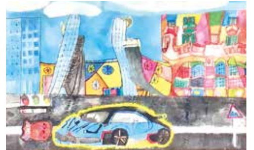
あーと でいくる〜ベ 「フガッティ世界めぐり気分」/松田大和