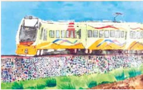
「風を切る特急いなほ」/佐藤暁