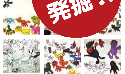
「どうぶつパレード」/宇藤楓